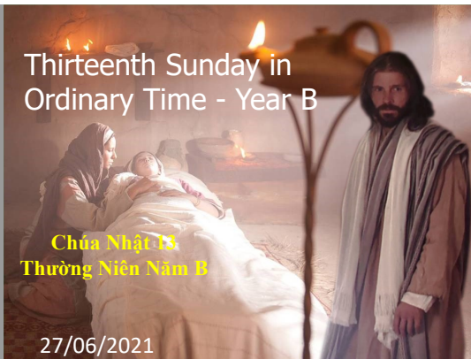
Chúa Nhật 13 Thường Niên Năm B

Alleluia, Đấng Cứu Độ chúng ta là Đức Giê-su Ki-tô đã tiêu diệt thần chết, và đã dùng Tin Mừng mà làm sáng tỏ phúc trường sinh. Alleluia